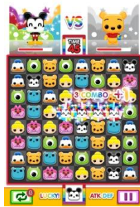
Disney Toy Rush(仮)