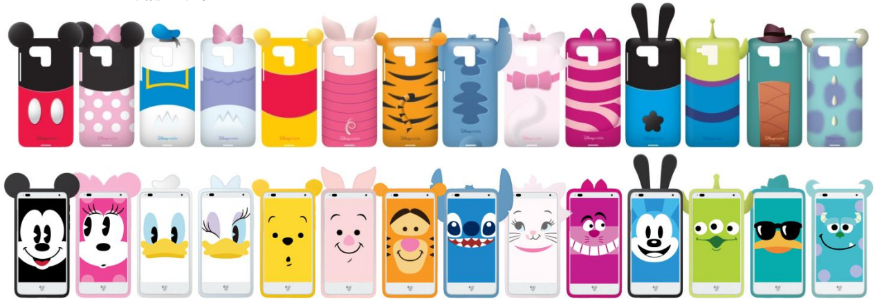
選べる10種類以上のキャラクターケース(上)、キャラクターの顔のライブ壁紙(下)

「マルチキャラクター」をテーマに開発したDM015Kは、端末デザイン、選べる10種類以上の立体的なケース、ライブ壁紙やウィジェットにいたるまで、多数のキャラクターを用意し、自分好みのキャラクターのスマートフォンにカスタマイズが可能です。