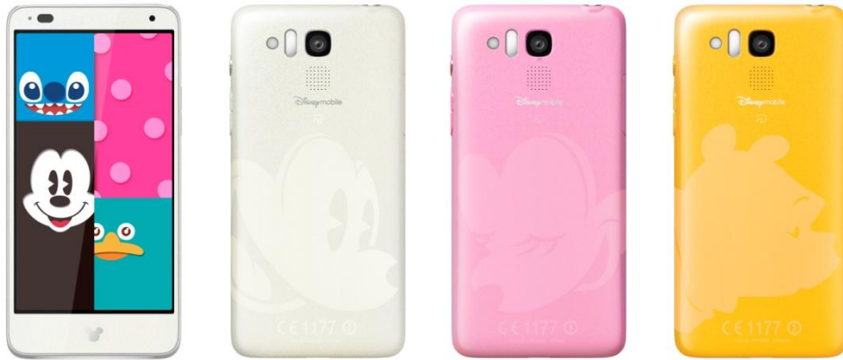
ディズニー・モバイル・オン・ソフトバンク「DM015K」

Based on the "Winnie the Pooh" works by A.A. Milne and E.H. Shepard.