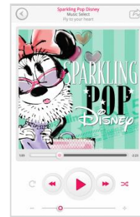
Disney Music Player(仮)