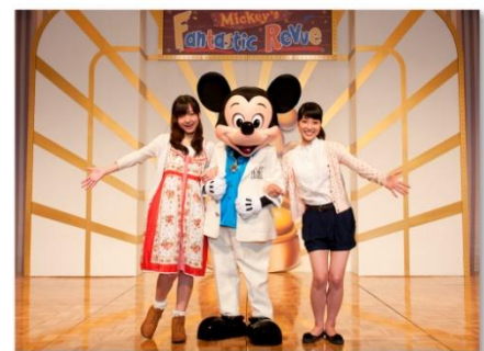
東京ディズニーシー・ホテルミラコスタ でのキャラクターグリーティング