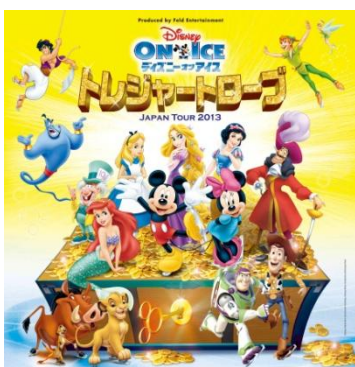
ディズニー・オン・アイス 「トレジャートロープ」

特典詳細は公式サイトにてご確認いただけます。URL: http://d.disneymobile.jp/benefit/