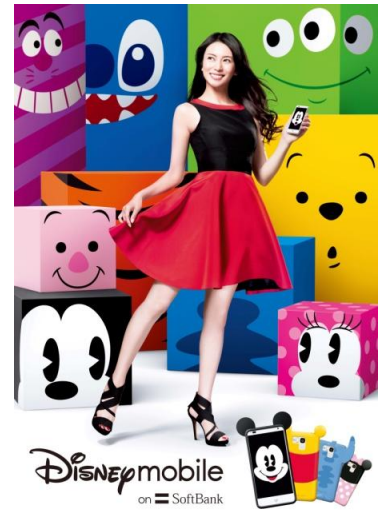
DM015K グラフィック広告より

様々なキャラクターが登場する、この夏にぴったりな POP・COLORFUL・PLAYFUL なテレビCMに是非ご注目ください。