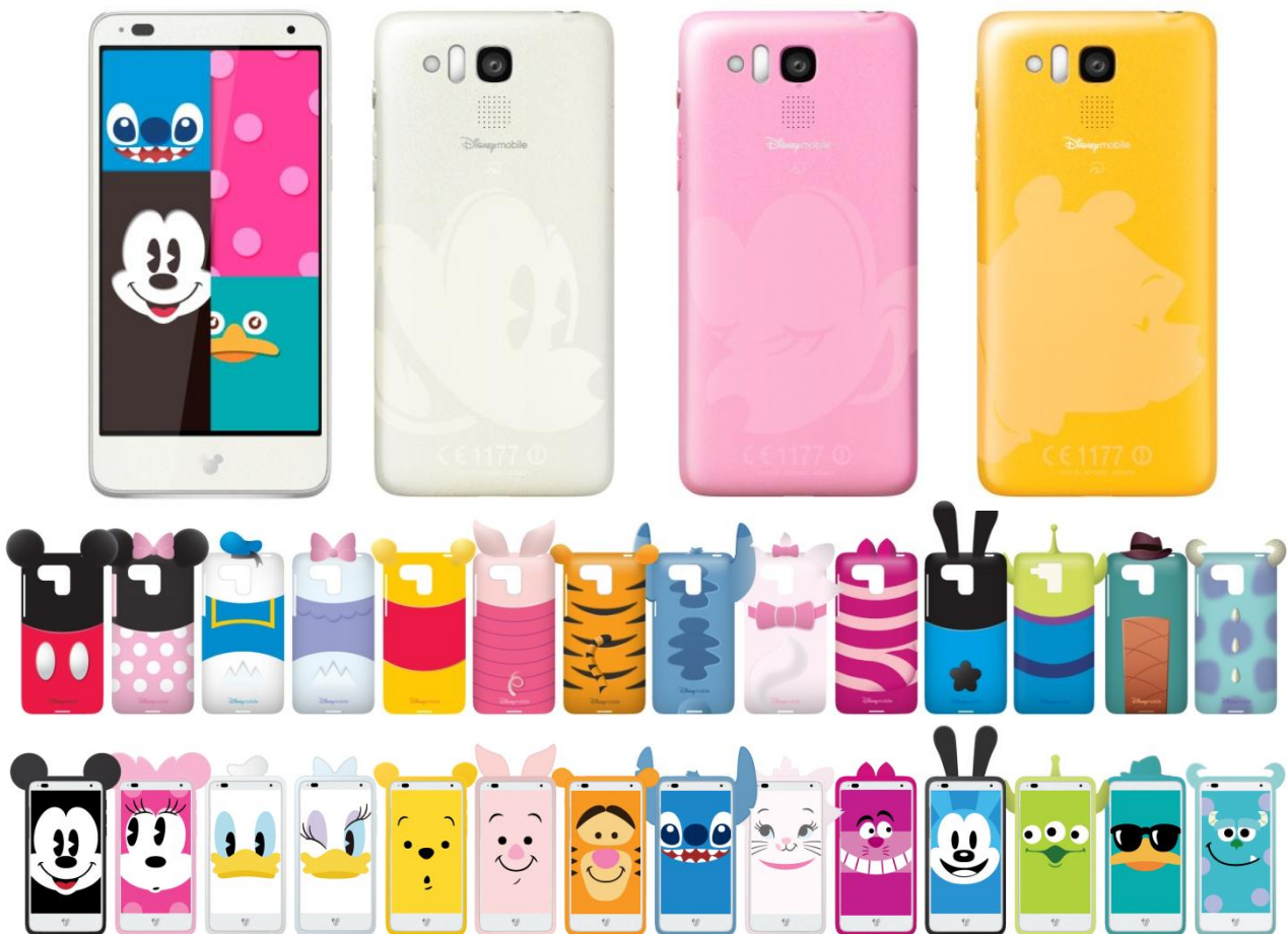
DM015Kと購入特典のオリジナルケース(上)、キャラクターの顔のライブ壁紙(下)

また、新たにドナルドダックとのインタラクティブな遊びが楽しめるアラームアプリ、「Disney Wake Up - Donald」やゲームアプリ「Disney Toy Rush」、音楽プレイヤー「Disney Music Player」を7月下旬より順次提供開始します。