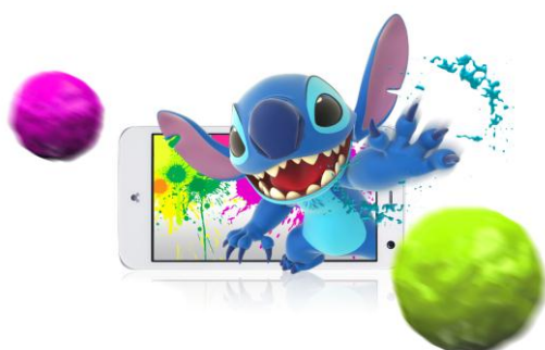
スティッチ・ペイント・スラッシュ