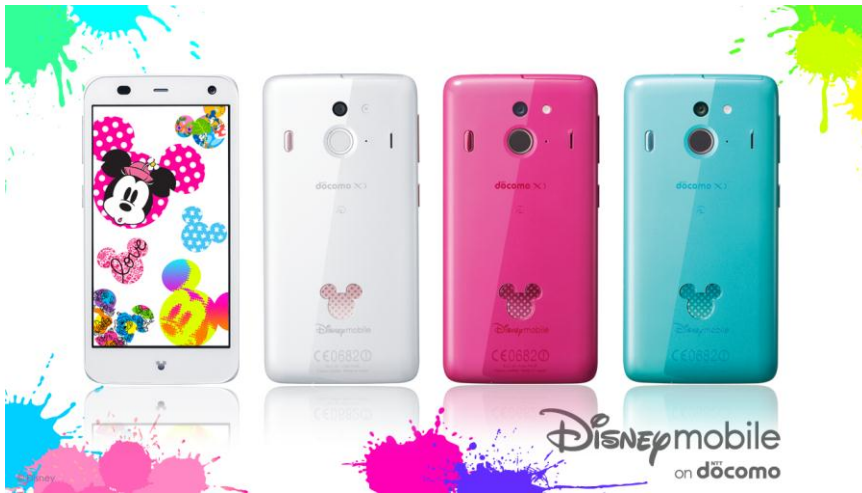
Disney Mobile on docomo 「F-03F」