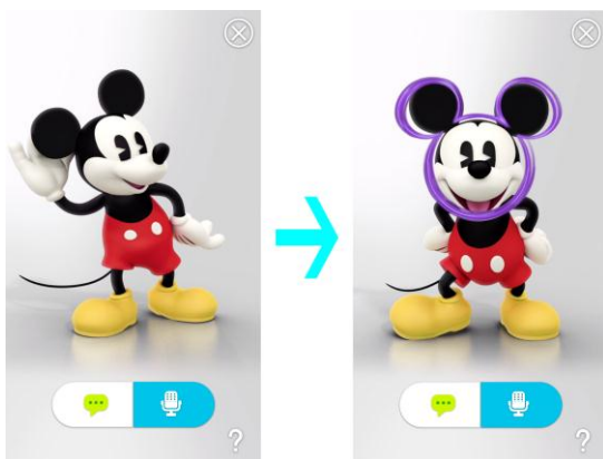
ハローミッキーライブ壁紙