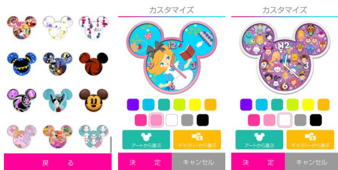
Disney 101 Art Alarm