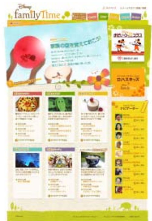
サイト Top 画像