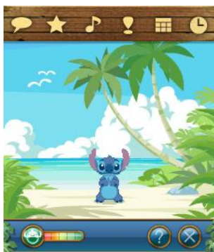
スティッチといっしょ