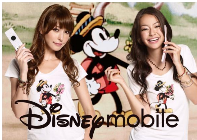
ディズニー・モバイル グラフィック広告より

また同日より、発売開始記念のスペシャルキャンペーンとして、購入者限定の「オリジナルデザインTシャツプレゼントキャンペーン」も開始します。