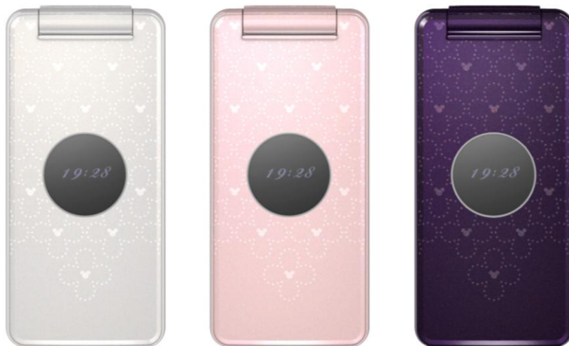
ディズニー・モバイル「DM004SH」