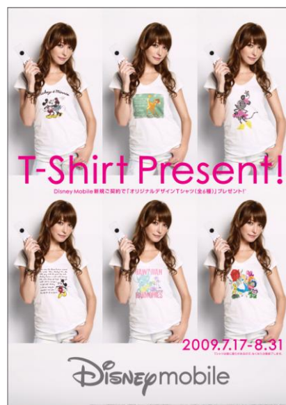
「オリジナルデザインTシャツ」