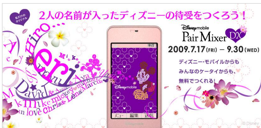
Disney Mobile ペアミキサーDX キャンペーン

Disney Mobile ペアミキサーDX キャンペーンは、自分と相手の名前を使ってオリジナルのディズニーキャラクター画像を作ることができるもので、本キャンペーンには誰でも無料で参加できます(ディズニー・モバイル以外の携帯電話からも参加可能)。Disney Mobile ペアミキサーDX では、自分と相手の名前、さらに恋人や友達などの関係に応じて2人の相性を診断し、自分だけのディズニーキャラクターの画像を作ることができるという企画です。できあがるキャラクター画像や背景は相性によって変化します。キャラクターと背景の組み合わせは300通り以上にもなり、相性がいいときだけに現れる特別なパターンもあります。また、毎日変わる診断結果に応じたアドバイスも楽しむことができます。