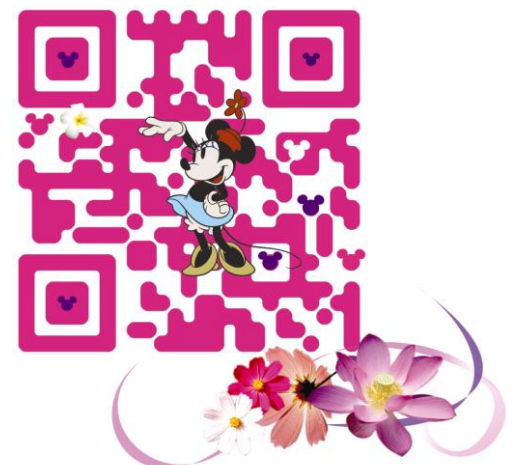
ディズニー・モバイル オリジナルデザインの 携帯アクセス用2次元バーコード