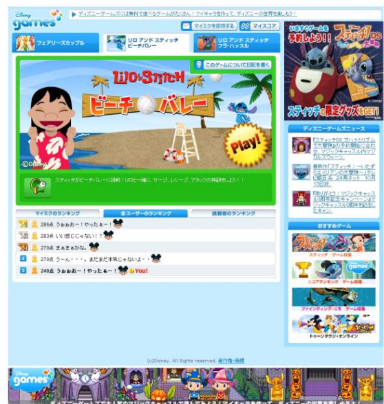
ディズニーゲームズ mixi アプリ Top ページ

また今回のアプリに続き、11月には「mixi モバイル」上で楽しめる「mixi アプリ」を2種提供開始し、その後も新しいコンテンツの提供を続けていく予定です。