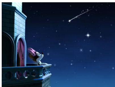
内蔵オリジナルムービー 「Sparkling Wish」