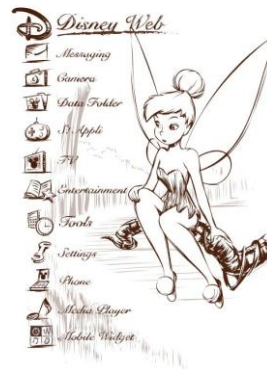
きせかえアレンジ 「Sketch Art」