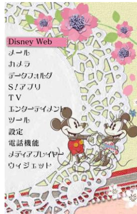
きせかえアレンジ 「Four Seasons」