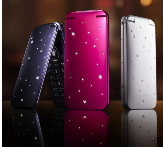
ディズニー・モバイル「DM005SH」

流線形のエレガントなラウンドフォルムや、散りばめられたラインストーンが高級感あふれる端末デザインを採用。「SUNRISE PINK」「MIDNIGHT BLUE」「STARDUST WHITE」の3色を用意し、イルミディスプレイや、キーイルミネーションなどと相まって、大人の女性の毎日のライフスタイルを華やかでエレガントに演出します。