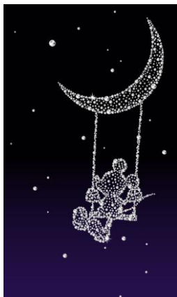
ラグジュアリー アニメーション