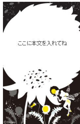
デコレメール テンプレート