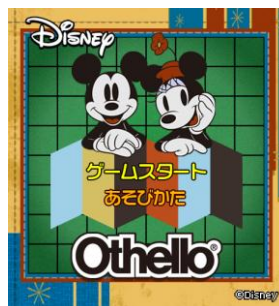
ディズニー オセロ