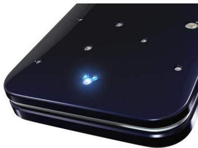
ミッキーシルエットの 着信ランプ