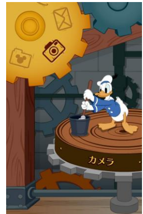
きせかえアレンジ 「Clock Cleaners」