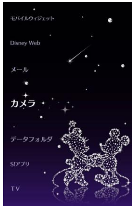
きせかえアレンジ 「Sparkling Diamond」

また、ディズニーのキャラクターと対戦できる「ディズニー オセロ」や、「人生ゲーム ディズニー版 お試しアプリ」を DM005SH にプリインストールしています。