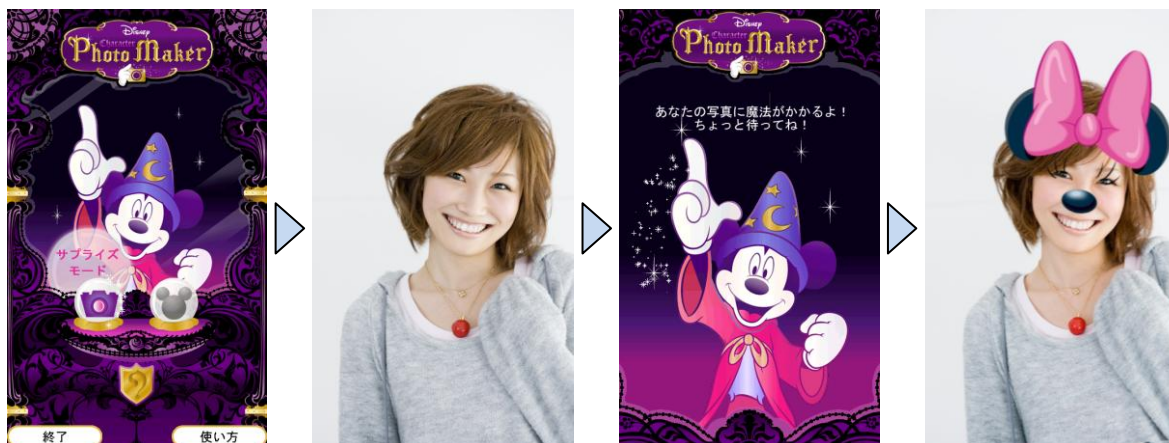
ディズニー・キャラクターフォトメーカー

ディズニー・キャラクターフォトメーカー: 撮影後の画像を使って、好きなキャラクターのなりきり画像を作ることができます。被写体がどのキャラクターに似ているかを自動判定する「サプライズモード」を選ぶと、全部で 50 種類の中からどんなキャラクターになるかを楽しむことができます。出来上がった画像はメールで友達に送信することができます。