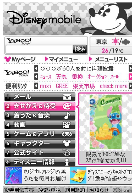
Disney Web 新 Top ページ

また、DM005SH に内蔵する「ディズニー・キャラクターフォトメーカー」をはじめとする新コンテンツの提供を3月5日より開始します。