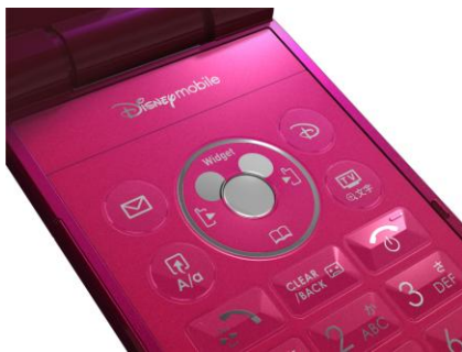
ミッキーシルエットの センターキー