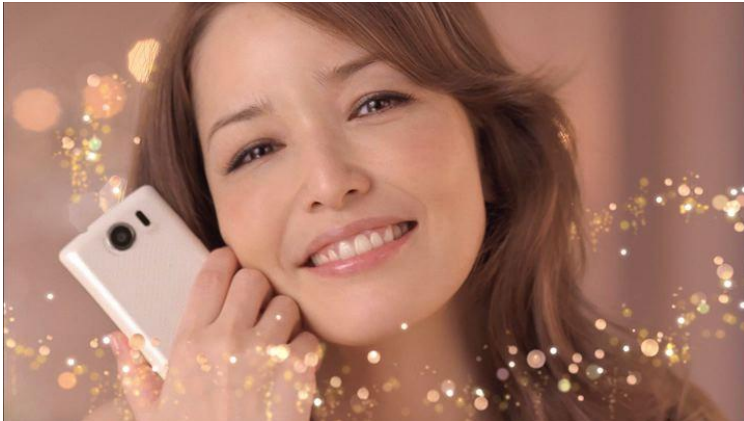
ディズニー・モバイル テレビCM「Story Book」篇

ニーならではのオリジナルコンテンツ、アプリ、UIなどをふんだんに盛り込んだ、華やかで、柔らかい、大人の女性に向けたテレビCMになっています。