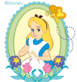
きせかえやデコメ、待受などの配信コンテンツ