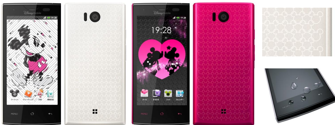
「DM012SH」 STYLE WHITE(左)、STYLE PINK(右)